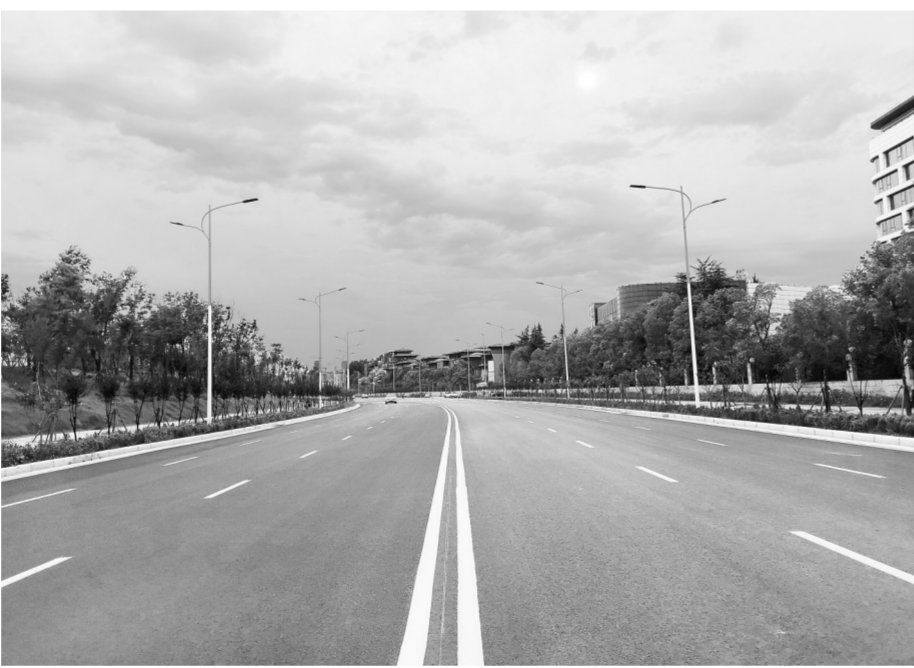
宽阔平坦的滨河路

滨河路(文化北路—中州大道)道路工程位于连霍高速公路以北,北四环以南,西起文化北路,东至中州大道,紧邻贾鲁河,是一条东西向城市主干路。滨河路打通工程是惠济区住建局2021年落实“我为群众办实事”活动的重要举措,该道路工程全长4136.183米,规划道路红线宽度45米,设计速度50公里/小时,其中