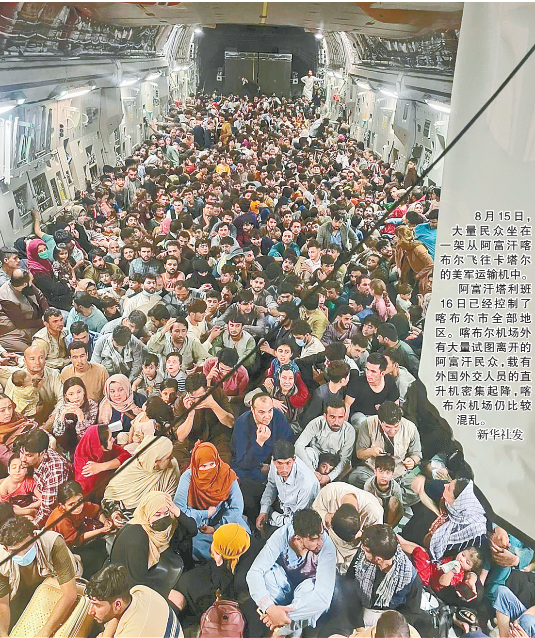
8月15日,大量民众坐在一架从阿富汗喀布尔飞往卡塔尔的美军运输机中。阿富汗塔利班16日已经控制了喀布尔市全部地区。喀布尔机场有大量试图离开的阿富汗民众,载有外国外交人员的直升机密集起降,喀布尔机场仍比较混乱。

新华社喀布尔8月17日电 阿富汗塔利班发言人扎比乌拉·穆贾希德17日在社交媒体上宣布,该组织对阿富汗政府全体工作人员及安全部队成员实施大赦。穆贾希德指出,塔利班目前已完全控制首都喀布尔的局势,法律和秩序已得到恢复。塔利班呼吁政府全体工作人员尽快返回工作岗位。