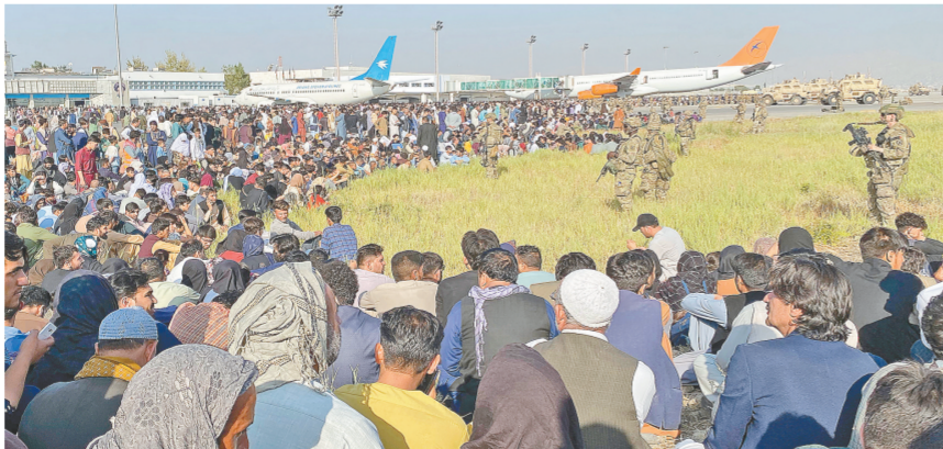
8月16日，美军在阿富汗喀布尔机场警戒。负责在阿富汗喀布尔机场外维持秩序的塔利班武装人员19日宣布，只有持合法证件者才被允许进入机场。18日，因机场门口聚集大量民众，塔利班武装人员多次朝天鸣枪驱散人群。

本月15日，阿富汗塔利班发言人纳伊姆宣布，塔利班武装人员已进入并控制了首都喀布尔。但随着美军撤离、阿富汗总统离开，塔利班迟迟未成立新政府，当前阿富汗正处于事实上的“无政府状态”。阿富汗民众认为在此情况下，安全是唯一重要诉求。阿富汗的局势也牵动着国际社会的神经。