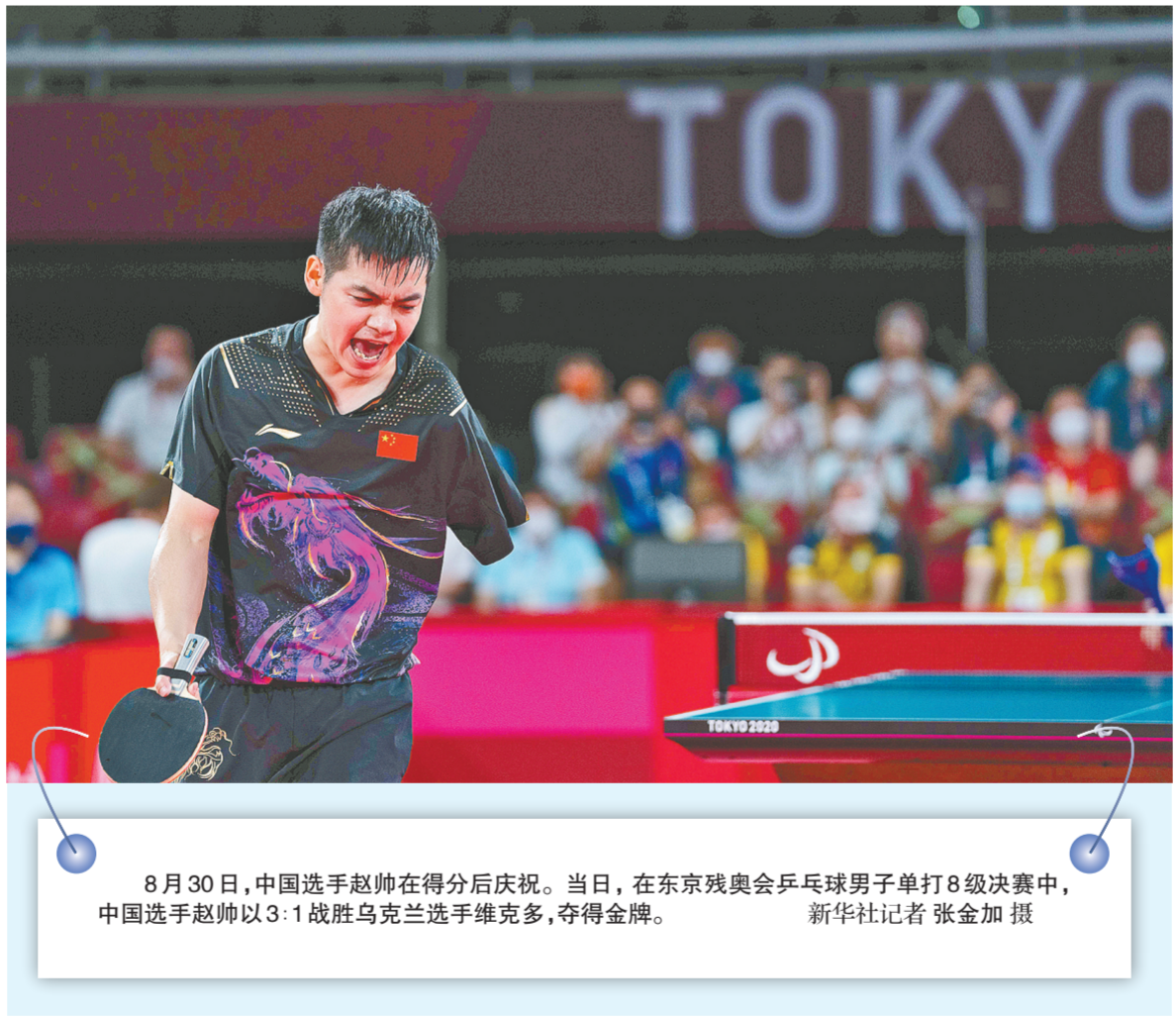
8月30日,中国选手赵鹏在得分后庆祝。当日,在东京残奥会乒乓球男子单打8级决赛中,中国选手赵鹏以3:1战胜乌克兰选手维克多,夺得金牌。