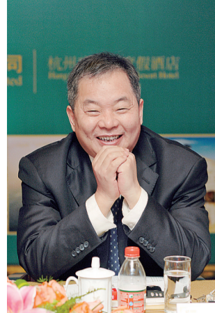
绿城集团创始人、蓝城小镇缔造者宋卫平

每个人心中都有一座桃花源。 “绿树村边合，青山郭外斜。开轩面场圃，把酒话桑麻。”这是孟浩然笔下的“桃花源”，充满乡土情趣、田园牧歌情调。 “忽逢桃花林，夹岸数百步，中无杂树，芳草鲜美，落英缤纷。”这是东晋陶渊明笔下的《桃花源记》，千余年来脍炙人口的《桃花源记》，千余年来脍炙人口的《桃花源记》，千余年来脍炙人口的《桃花源记》，千余年来脍炙人口的《桃花源记》。 “小镇是人类社会发展过程中一个奇妙又有价值的社会实践。在小镇中，每一个人对世界的美好向往和认知，都能得到充分的沟通和分享。老吾老，幼吾幼，小镇将成为‘飘落人间的天堂’。”理想小镇，是一个比城市更温暖，比乡村更文明的地方。 这是绿城集团创始人、蓝城集团董事长、享有中国房地产“品质教父”之称宋卫平的“小镇观”，也是蓝城让梦想照进现实的“桃花源”。