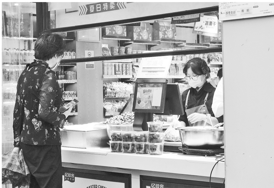
复苏小店经济,回归“人间烟火”。图为纬五路一家店铺近日恢复营业,人气回暖 本报记者 丁友明 摄

根据《意见》,我省将释放扩展小店发展空间,优化小店空间布局,完善小店基础设施建设,拓展小店聚合服务能力。通过在居民区、写字楼、医院、学校、体育场馆、公园景区增加小店经营摊位,多渠道提升对小店的承载力和吸附力。支持小店开发自有品牌商品,搭载生活缴费、公交充值、自助购买彩票、打印复印、洗衣家政、快递收发等便民生活服务项目,满足居民便利消费需求。鼓励小店设置简餐、饮品、休闲、阅读、社交区域,拓展图书、报纸、杂志、音像制品等延伸项目,支持小店按有关标准申请乙类非处方药零售经营权,鼓励小店延长营业时间,支持开设24小时便利店等。