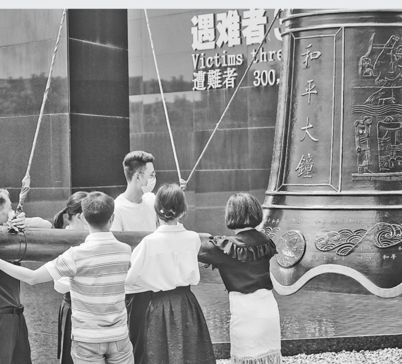
9月3日，人们在侵华日军南京大屠杀遇难同胞纪念馆撞响和平大钟。南京大屠杀幸存者后代、师生代表、媒体代表等12人参加撞钟仪式，大钟撞响13声，纪念中国人民抗日战争暨世界反法西斯战争胜利76周年。

日战争的峥嵘岁月，阐述了中国人民抗日战争暨世界反法西斯战争胜利的伟大意义，充分表达了铭记历史、缅怀先烈、珍爱和平、开创未来的决心和信心，充分表达了坚定不移走和平发展道路的崇高愿望。 座谈会由中央宣传部、中央统战部、中央党史和文献研究院、中央军委政治工作部联合举办。在京参加过抗日战争的老战士及抗战将领亲属代表、抗战烈士遗属代表，中央党政军群有关部门和北京市负责同志，各民主党派中央、全国工商联负责人和无党派人士代表，在京为中国人民抗日战争胜利作出贡献的国际友人遗属代表，首都各界群众代表等约160人参加座谈会。