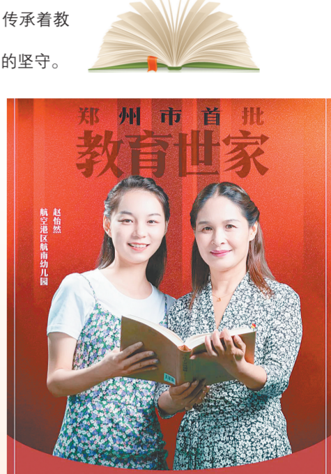
郑州市首批教育世家