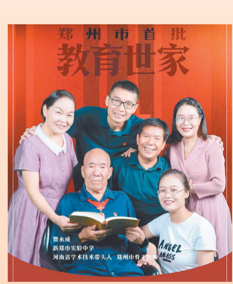
郑州市首批教育世家