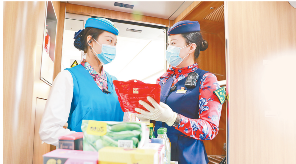
郑铁担当的动车组列车、普速列车全部恢复开行

铁路部门提醒旅客,列车开行相关信息,请以12306网站或车站公告为准。旅客乘坐火车出行,须全程佩戴口罩,出示行程码和健康码绿码。前往北京方向的旅客需出示“北京健康宝”绿码,各地区进、出站旅客暂不需要提供核酸检测阴性证明。