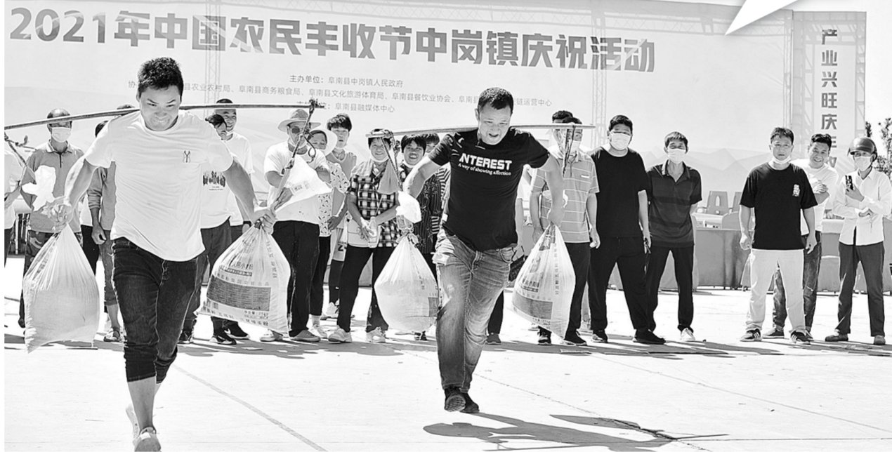
2021年中国农民丰收节中岗镇庆祝活动