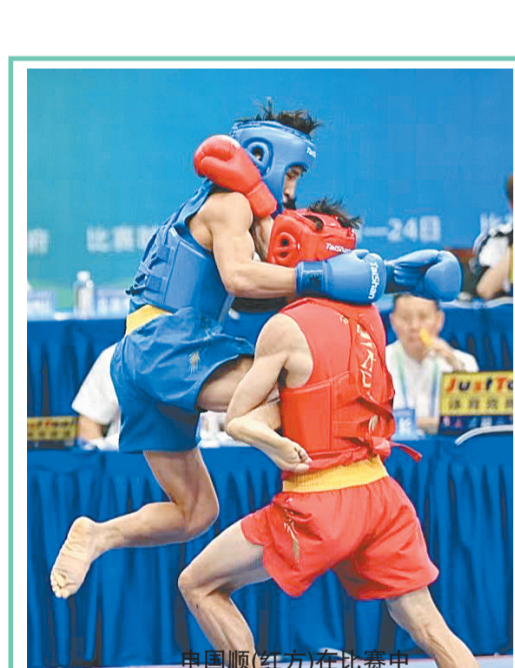
中国队（红方）在比赛中

近年来，河南博物院作为国家文物局确定的“首批可移动文物保护修复优质服务机构”充分发挥文保优势，保护修复了一大批馆藏珍贵文物。此次保护修复的50件181册古籍善本属于珍贵的文献资料，经过保护修复后达到了展览、研究等使用价值，对今后的文献资料研究具有关键的意义。