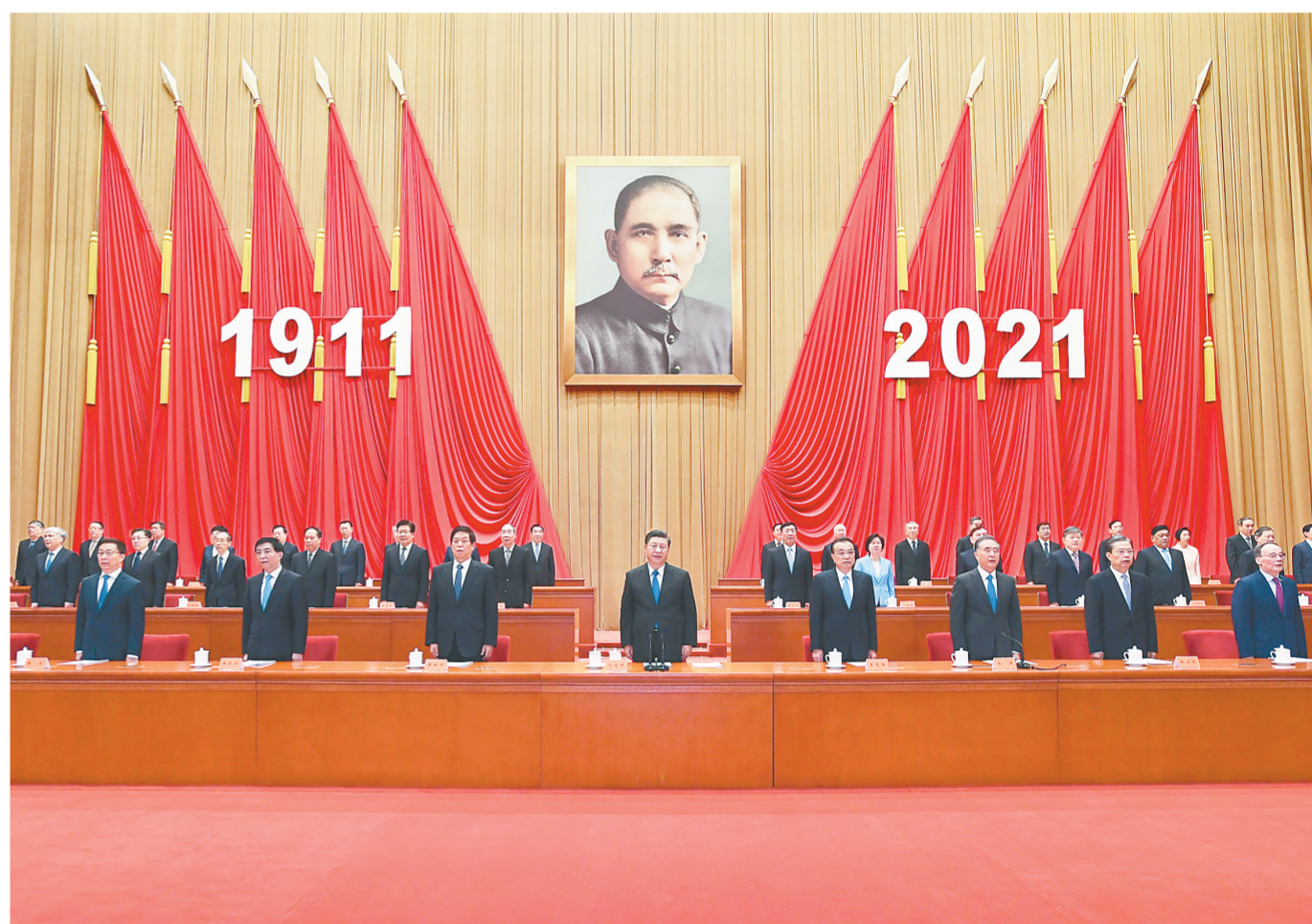
10月9日，纪念辛亥革命110周年大会在北京人民大会堂隆重举行。习近平、李克强、栗战书、汪洋、王沪宁、赵乐际、韩正、王岐山等出席大会。