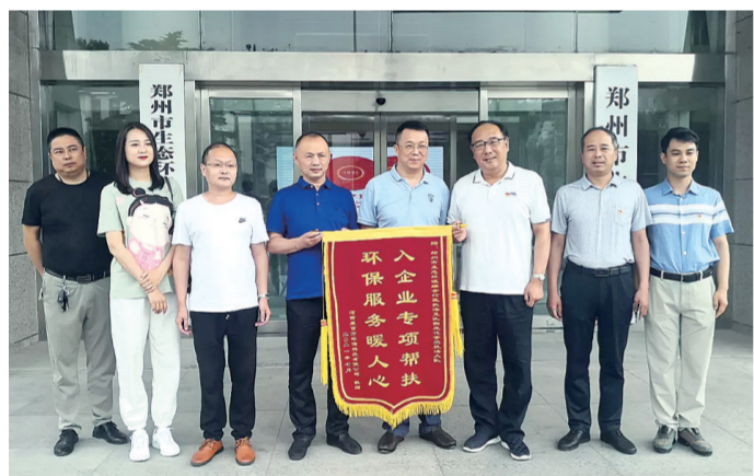
巩义河南康百万环保科技有限公司送来锦旗，感谢固大执法人员的帮扶。