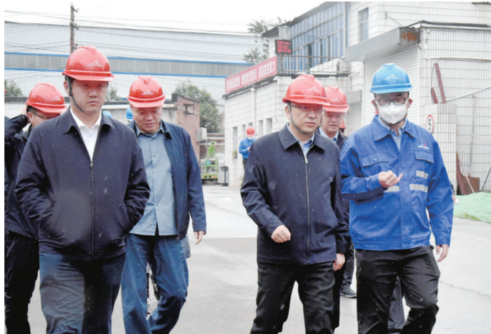
登封调研指导灾后重建工作现场。

今年7月以来，针对“7·20”特大暴雨灾害和新冠肺炎疫情严重冲击，工业企业生产、经营困难重重的局面，郑州市生态环境局积极响应省委省政府、市委市政府工作部署，以“万人助万企”为抓手，高点站位、加压奋进，以担当干事、破解难题、善作敢为的作风，按照小切口大文章、小窗口大服务、小程序大帮扶的原则制定专项工作方案，紧扣企业需求、畅通沟通渠道，坚持问题导向、注重精准发力，落实落细各项惠企政策，用心用情帮助企业化解难题、脱离困难，精准帮扶企业扩大生产、加快发展，有效服务了全市经济平稳运行，全市生态环境系统服务企业水平明显提高，环境保护工作实现大提升。