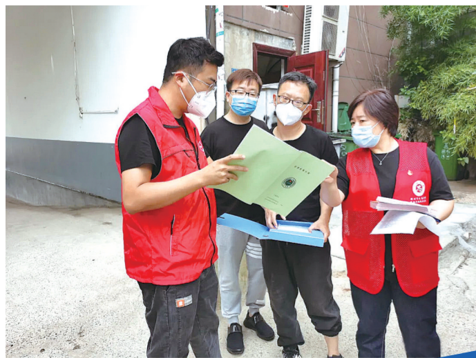
工作人员走进企业开展政策帮扶。