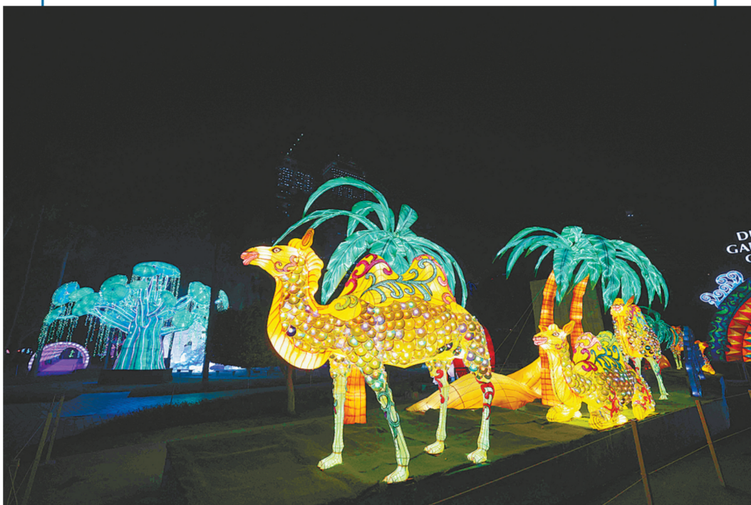
这是11月1日在阿拉伯联合酋长国迪拜拍摄的灯光装置。来自世界各地的艺术家用超过一百万只节能灯泡及回收再利用的织物制作了色彩斑斓的灯光装置,吸引了众多游客参观。