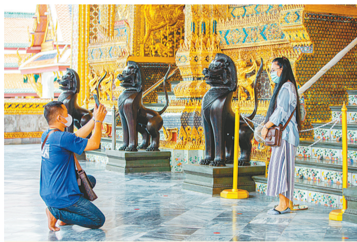
11月1日,游客在泰国曼谷大皇宫景区拍照。泰国曼谷11月1日起重新开放因新冠疫情关闭的大皇宫景区,允许民众在遵守防疫措施的前提下参观游览。