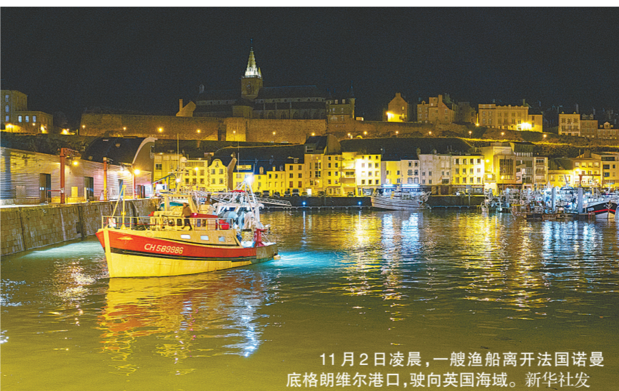
11月2日凌晨,一艘渔船离开法国诺曼底格朗维尔港口,驶向英国海域。

按照今年1月1日生效的英国“脱欧”后相关贸易协议,欧盟国家渔民要想进入英国海域捕鱼,需要事先提交在这一海域捕鱼的历史证明,方可获得许可。