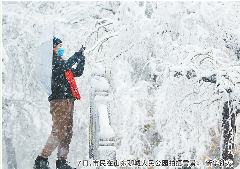
7日，市民在山东聊城人民公园拍摄雪景。