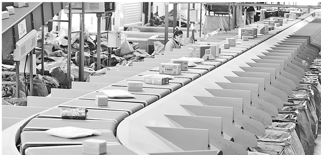
快递企业通过更新智能分拣设备、增派人手,提升仓储和配送能力,积极应对“双11”快递物流高峰。图为在淮北市烈山区一家快递企业分拨中心,工作人员在分拣车间忙碌。

熬最深的夜抢最大的红包,用最快速度成为第一波“尾款人”……今年的“双11”,火热的购物狂欢依旧。从仅为1天的购物节,到如今持续1个月的超长购物周期,“双11”逐渐脱离“仅此1天”的时间限制,已然成为强劲消费力的代名词,折射出我国消费市场的蓬勃生机。