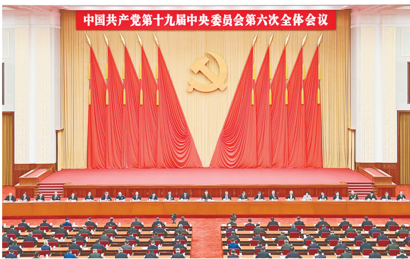
中国共产党第十九届中央委员会第六次全体会议,于2021年11月8日至11日在北京举行。