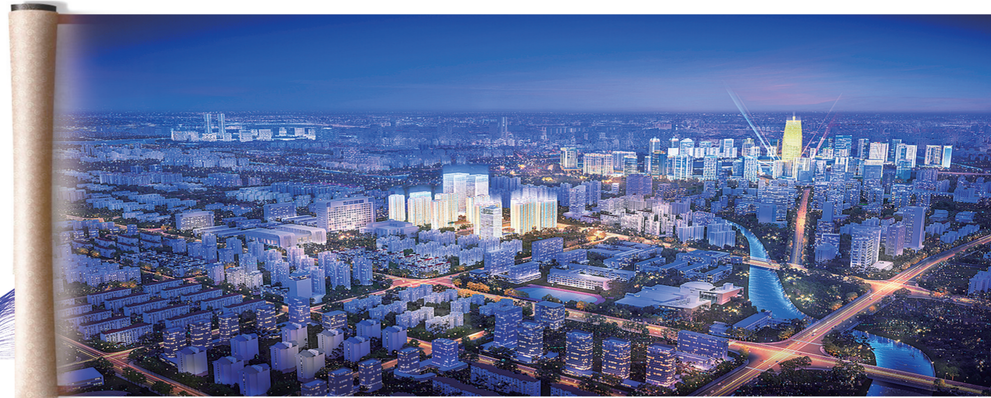
金水、郑东交相辉映。敏捷·江山誉区位示意图