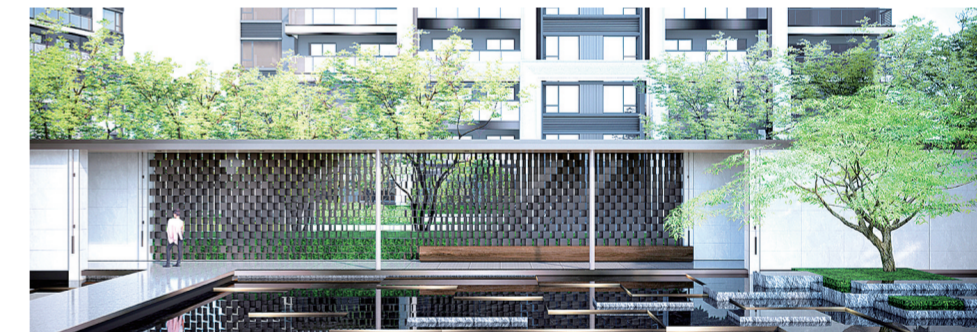
敏捷·江山誉景观效果图