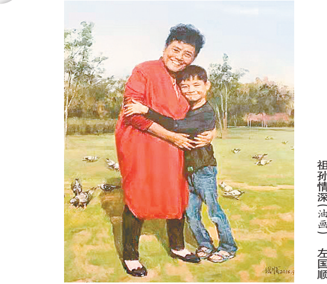
祖孙情深(油画) 左国顺

洗菜的老板娘点菜,焖罐肉,红烧桂花鱼,油炸青虾,地菜皮炒鸡蛋,野葱煎豆腐,特别要求必须是淮城的黑毛猪和宝月湖的桂花鱼。老板娘将湿淋淋的手在围裙上擦净,笑着在点菜单上一一记下。船舱中央有一张仿古画案,几个人坐定,山庄的老板给大家泡