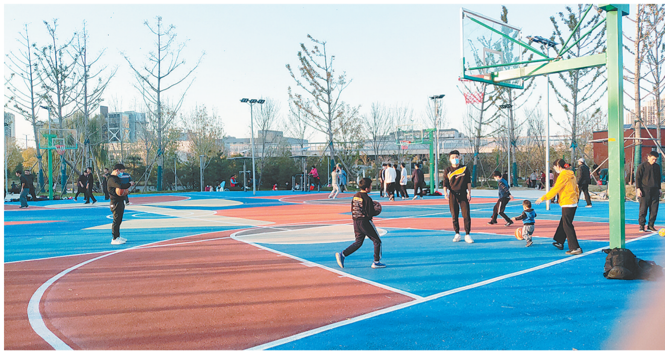
郑州市青少年公园经过市环道绿化管理处不断完善管理设施，积极督促施工标段加快施工进度，近日正式对市民开放，让市民更好地享受园林绿化建设成果。

“我为群众办实事”聚焦老旧小区、公园升级改造，老旧小区焕新貌，开放公园颜值高，居民生活环境得到切实改善，居住品质得到有效提升。