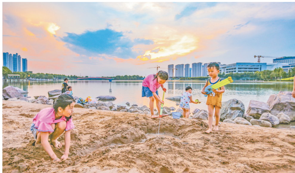
↑作为高新区党史学习教育“我为群众办实事”实践活动之一，天健湖公园沙滩广场升级改造工作于今年7月完成，成为市民休闲遛娃好去处。