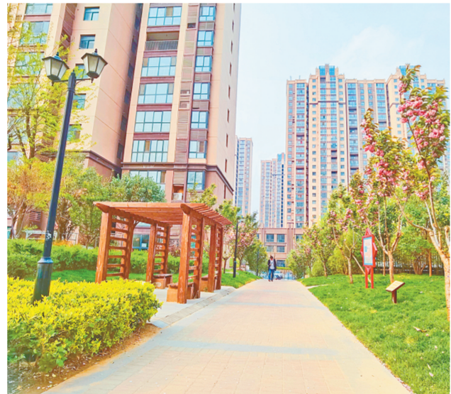
近日，二七区马寨镇刘胡垌村实施安置区环境绿化提升工程，硬化路面、栽树种花、铺设草地、安装电动车棚、设置游乐设施、实行垃圾分类……让居民生活条件得到质的提升。