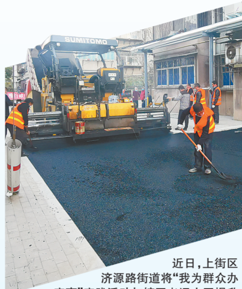
近日，上街区济源路街道将“我为群众办实事”实践活动与辖区老旧小区提升改造相结合，督促施工人员在小区内铺设沥青路面，解决道路坑洼不平问题，将民生实事办到群众心坎里。