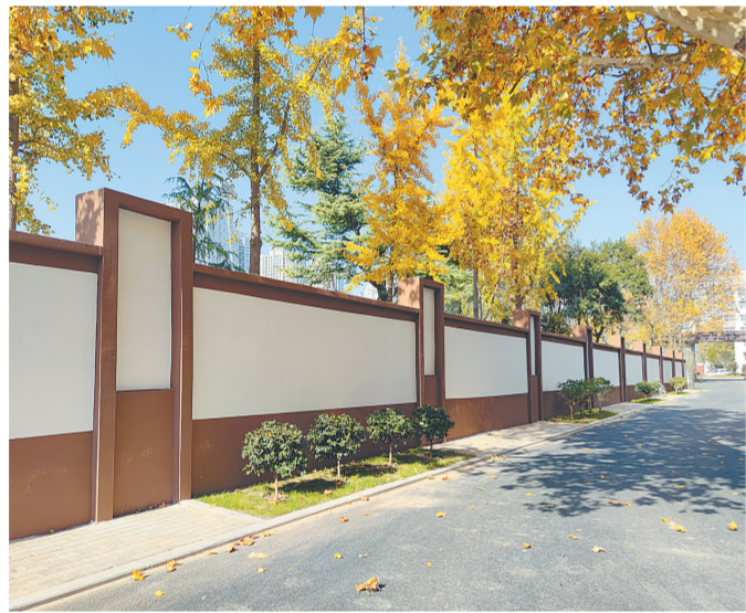
近日，二七区长江路街道建立健全老旧小区改造“一核多元”组织体系，制定群众满意的改造“幸福菜单”，为测绘学院家属院安装感应水泵、单元防水板、太阳能路灯、智能摄像头等设施，加快“老旧小区、家园重建”步伐。