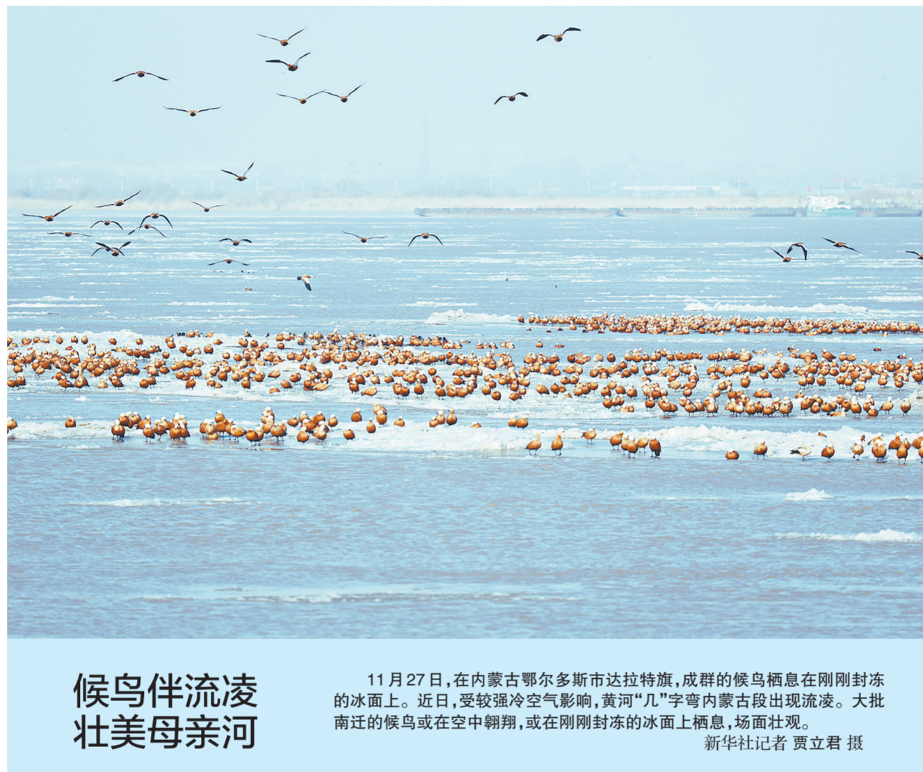
候鸟伴流凌 壮美母亲河

为给参保人提供高效便捷的医保服务，《办法》规定参保人可以通过线上或线下方式申请办理基本医保关系转移接续。转出地和转入地经办机构均已上线全国统一的医保信息平台，且开通转移接续业务线上办理渠道的，申请人可通过国家医保服务平台首页下方的地方网厅入口提交申请，也可在转入地或转出地经办机构窗口申请。