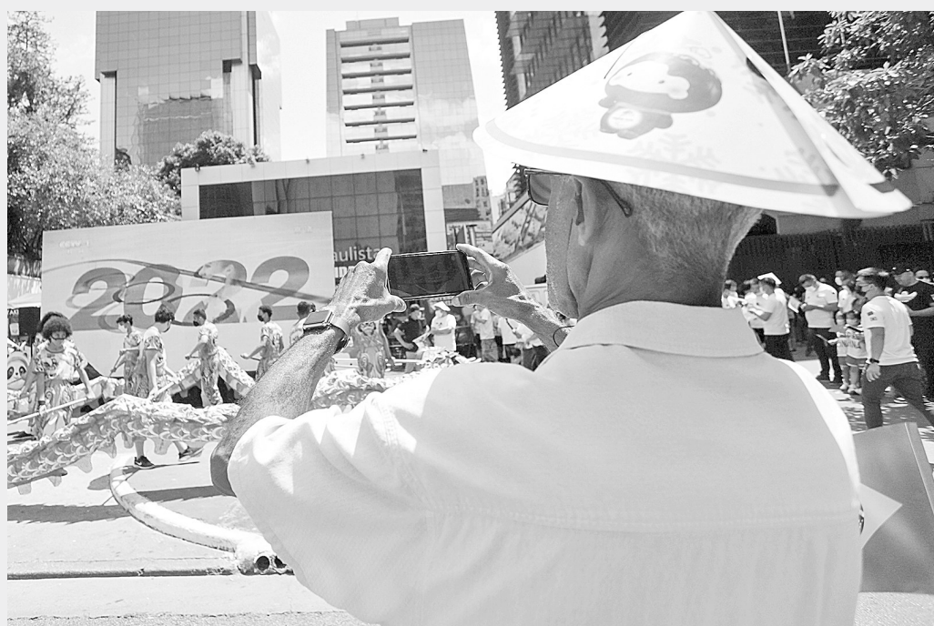
11月28日，一位男子在用手机拍摄舞龙舞狮表演。当日，圣保罗华人团体在圣保罗市保利斯塔市场购物中心举办“迎接2022北京冬奥会主题喜庆游园”活动，庆祝北京冬奥会开幕进入倒计时。

而且在每个单人项目上还拿满了3个参赛资格。加拿大队和韩国队在某些单项上未能取得满额参赛资格。 当日女子1000米比赛，三位中国选手韩雨桐、张雨婷、张楚桐均在四分之一决赛就被淘汰，韩国名将崔敏静获得冠军。男子1000米比赛，武大靖在四分之一决赛中位列小组第二晋级，但半决赛仅列小组第四，没能晋级决赛。安凯则止步四分之一决赛。最终匈牙利的刘少昂夺金。 女子3000米接力，由范可新、韩雨桐、张楚桐和张雨婷组成的中国队半决赛排名第三无缘争冠。男子5000米接力半决赛，中国队派出安凯、任子威、孙龙、李文龙出战，以小组第二晋级决赛。决赛中，中国队位列最后一名。韩国队最终夺冠。 2000米混合接力半决赛，中国队由范可新、任子威、孙龙、张楚桐组成，以小组第二晋级决赛。决赛中，中国队位列第三，获得铜牌。荷兰队夺冠。 凭借此前武大靖的500米金牌和任子威的1500米金牌，再加上混合接力的铜牌，中国队在本站世界杯以两金一铜收官。