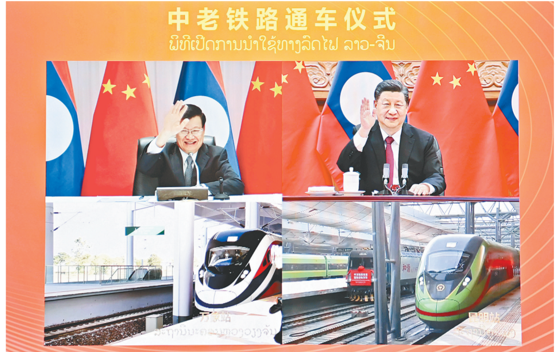
12月3日下午,中共中央总书记、国家主席习近平在北京同老挝人民革命党中央总书记、国家主席通伦通过视频连线共同出席中老铁路通车仪式。