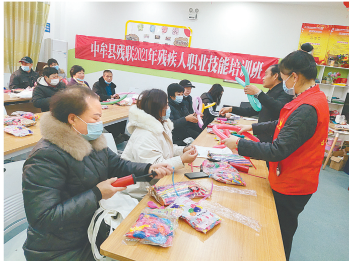
12月13日,中牟县刘集镇绿博家苑社区党群服务中心与镇民政所联合组织社区内的残疾人开展了以“我为群众办实事”手工艺气球职业技能培训活动,让残疾人掌握一技之长,增加就业创业机会。