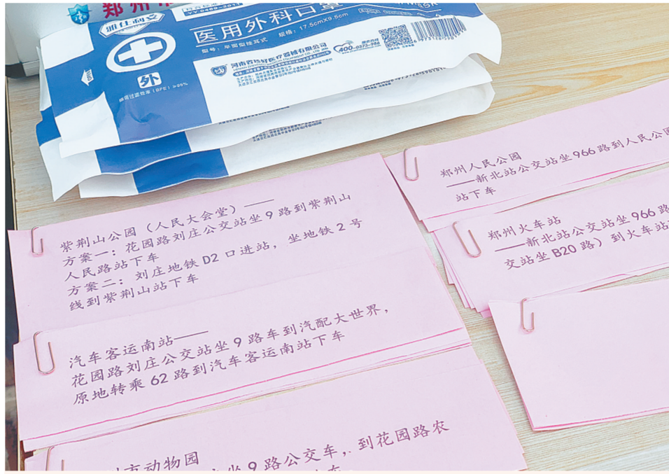
郑州公交第二运营公司二车队在开展“我为群众办实事”活动中,为回应老年乘客智慧出行的需求,帮助老年乘客跨越“数字鸿沟”,融入智慧生活,有效帮助老年人乘车出行,介绍公交线路走向和沿途衔接线路,满足出行所需,该车队在刘庄公交场站北门设立了一个“公交问询处”,提供换乘咨询和手机应用咨询服务。