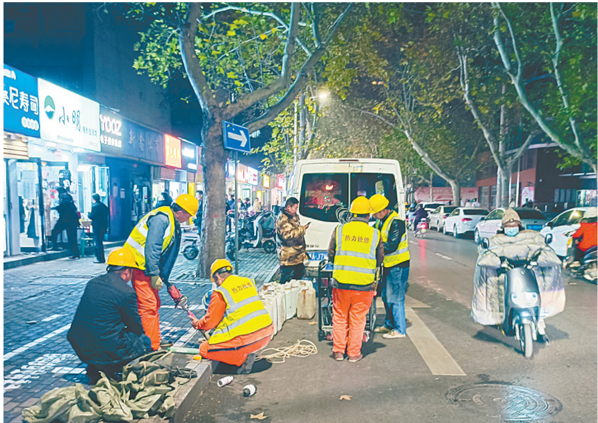
12月13日,记者从郑州热力集团有限公司获悉,由于健康路(黄河路—优胜南路)管网老化和部分管段锈蚀严重,近几年均有不同程度的泄漏、爆管情况发生,为消除安全隐患,实事实办,郑州热力12月11日~31日对此路段管网实施改造。施工期间暂不影响用户正常供热。