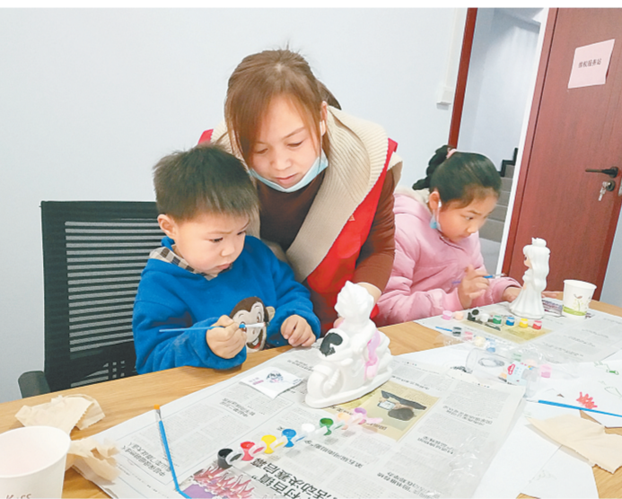
上街区济源路街道民安社区为助力“双减”取得实效,扎实开展“我为群众办实事”实践活动,社区举办了以“多彩童趣 欢乐涂鸦”为主题的文化活动,以扩展孩子们想象力的文化生活。