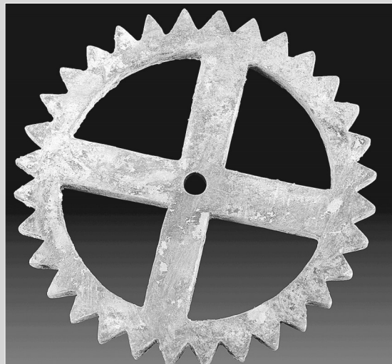
江村大墓外藏坑出土的铜齿轮