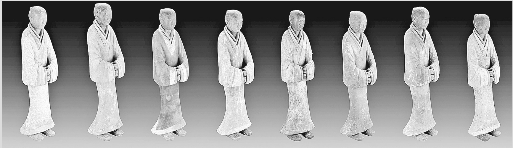
薄太后南陵外藏坑出土的一组陶俑

据新华社北京12月14日电 聚焦汉唐时期重要考古发现和研究成果，国家文物局14日在京召开“考古中国”重大项目重要进展工作会，通报陕西西安江村大墓、河南洛阳正平坊遗址、甘肃武威吐谷浑墓葬群等3项重要考古成果。