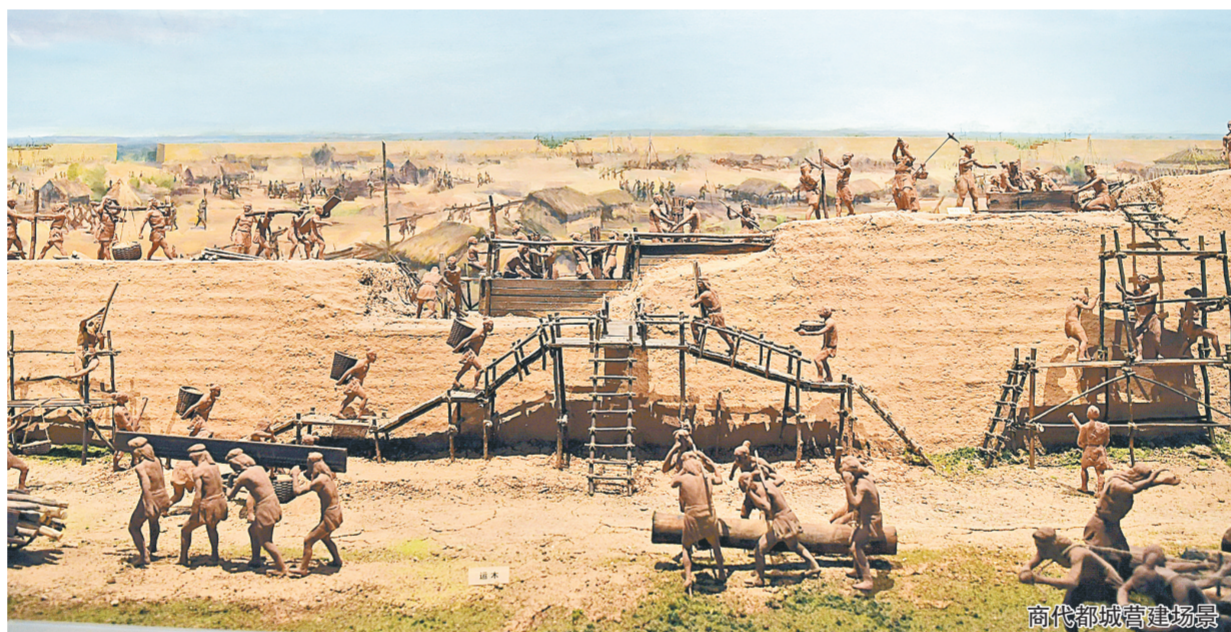
商代都城高墙遗址

本报讯(记者 成燕 李焱图)昨日上午,位于郑州商代遗址公园内的郑州商都遗址博物院和郑州市文物考古研究院考古博物馆举行试开馆仪式。