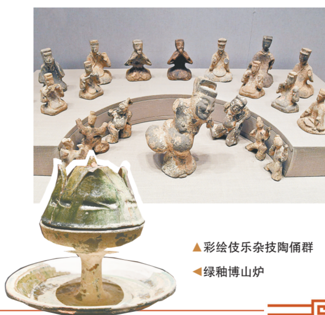
彩绘伎乐杂技陶俑群

有关部门提醒,商城遗址公园位于市中心,周边停车场比较紧张,建议选择绿色出行方式来馆参观。