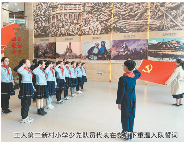
工人第二新村小学少先队员代表在国旗下重温入党誓词