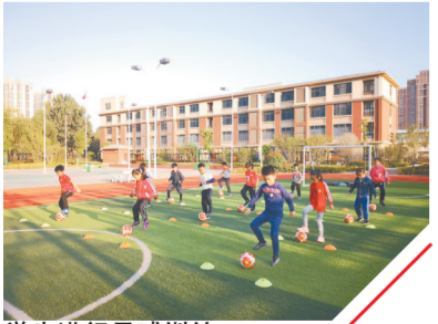
学生进行足球训练