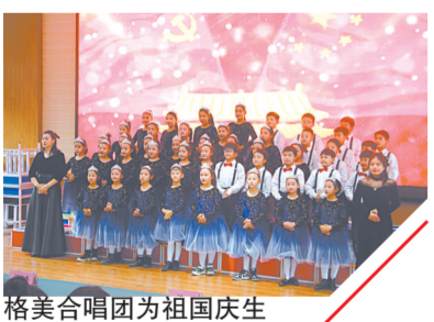
格美合唱团为祖国庆生

自2017年建校以来，每一学期学校都会组织开展骨干教师示范课、年轻级科推优课、新任教师展示课等课例观摩活动。