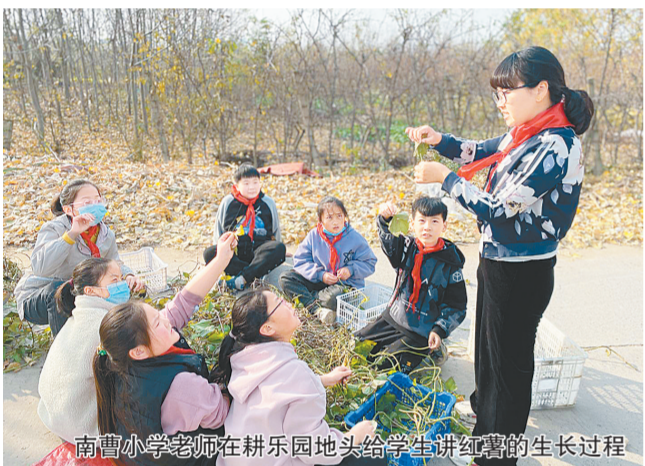
南曹小学老师在耕乐园地头给学生讲红萝卜的生长过程

加强党对教育工作的全面领导，是办好教育的根本保障。一年来，管城回族区坚持党对教育工作的全面领导，聚焦“快、浓、新”三步棋，召开教育系统党史学习教育动员会，制定《中共管城回族区教育局党组关于在全区教育系统开展党史学习教育的工作方案》。