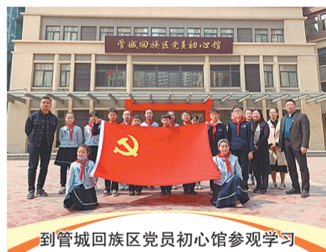
到管城回族区党员初心馆参观学习

工人第二新村小学文明之风不仅体现在校园环境上，更体现在“时时受教育，处处受感染”的德育氛围中。该校少先队秉承“相约魅力工二遇见最美童年”的理念。