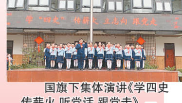
希望小队诗词致敬英雄