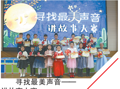
寻找最美声音——讲故事大赛

级学科推优课、新任教师展示课等课例观摩活动，实现全校教师全覆盖，通过教师之间相互观摩切磋，共同探讨教学新模式。