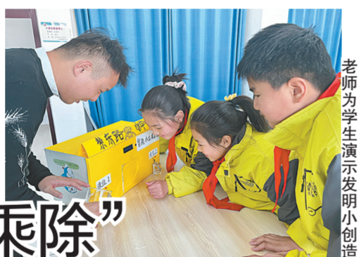
老师为学生展示发明小创造