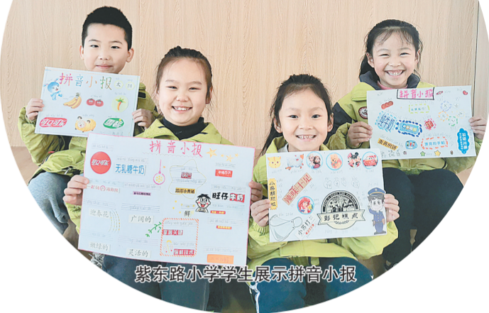
紫东路小学学生展示拼音小报

在教师资格认定、注册、招聘等方面，该区2021年完成2471人次教师资格面试、办证工作，选派293名面试官，圆满完成了管城考点的面试工作。