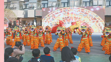
曲艺小舞台——戏曲演唱

式，抓住重要时间节点，组织开展了一系列特色少先队活动，坚持形象化、情感化、榜样化、行动化。