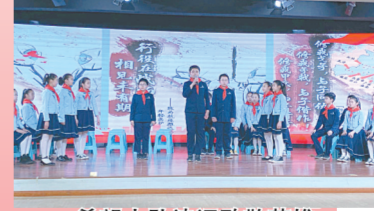
开幕式上精彩的舞龙舞狮表演