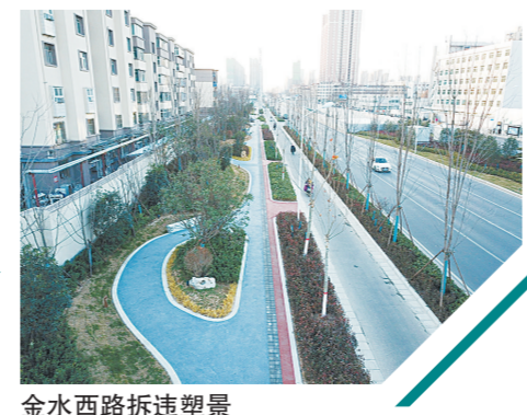
金水西路拆违塑景