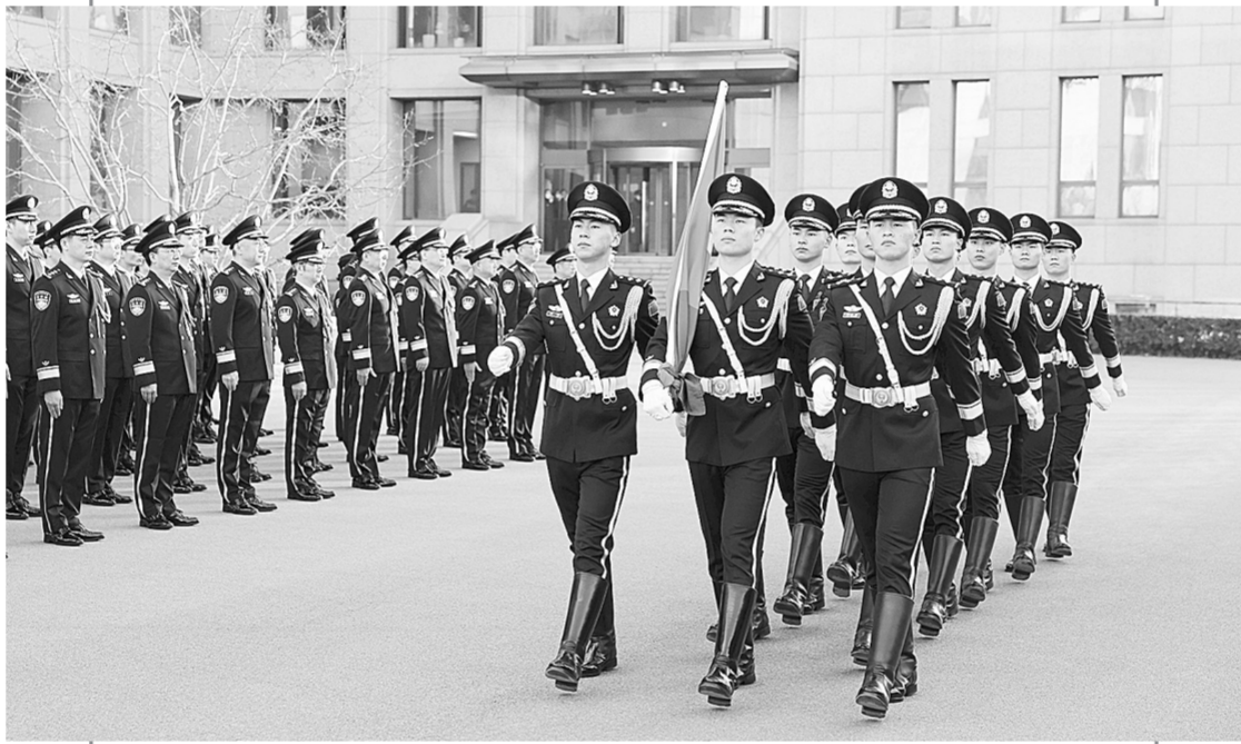
1月10日晨，公安部举行升警旗仪式庆祝中国人民警察节，部机关干部代表200余人参加。新华社记者 殷刚 摄