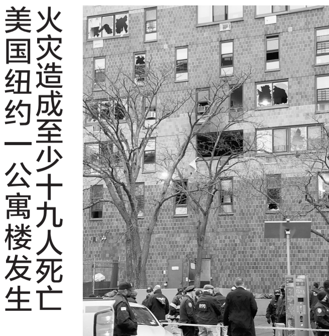
美国纽约市一栋公寓楼9日发生火灾，造成至少19人死亡，其中包括9名儿童。图为1月9日拍摄的美国纽约市布朗克斯区发生火灾的公寓楼。