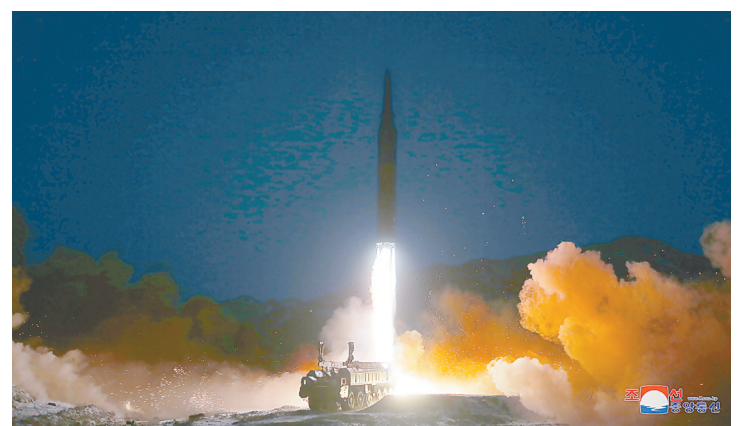
这张朝中社1月12日提供的照片显示的是朝鲜国防科学院进行高超音速导弹试射现场。

朝中社12日发布消息,证实朝鲜11日试射高超音速导弹,朝鲜最高领导人金正恩到场观看试射。