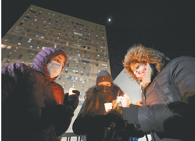
1月11日,人们在美国纽约市参加烛光守夜活动,悼念布朗克斯区公寓楼火灾遇难者。