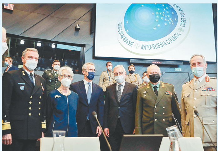
1月12日,在比利时布鲁塞尔,俄罗斯外交部副部长亚历山大·格鲁什科(右三)、美国副国务卿温迪·舍曼(左二)、俄罗斯国防副部长亚历山大·福明(右二)、北约秘书长斯托尔滕贝格(右四)等出席北约—俄罗斯理事会会议。

近年来,北约与俄罗斯关系持续走低。去年10月,俄方宣布暂停俄驻北约及北约驻俄相关机构的工作,回应北约当月初驱逐俄方外交官。