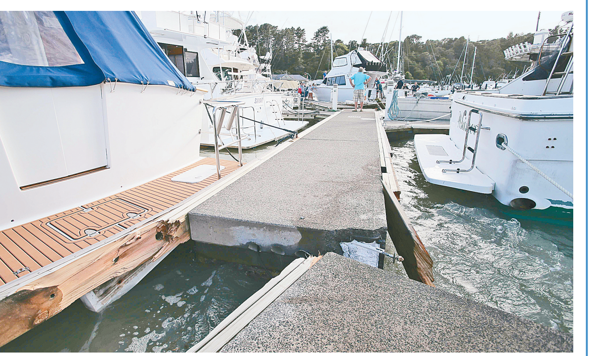
南太平洋岛国汤加的洪阿哈阿帕伊岛海底火山15日发生剧烈喷发，多国发布了海啸预警。图为1月16日在新西兰图图卡卡拍摄的断裂的码头。

据联合国网站15日报道，古特雷斯还对澳大利亚、新西兰、日本和美国等环太平洋国家发出的海啸警报表示关注。 据汤加地质局消息，位于汤加首都努库阿洛法以北约65公里处的洪阿哈阿帕伊岛15日开始火山喷发，大量火山灰、气体与水蒸气形成巨大云团。另据当地媒体报道，洪阿哈阿帕伊岛海底火山15日发生第二次剧烈喷发，火山灰柱直径约5千米、高20千米，笼罩在火山上空。截至15日夜间，火山灰还在不停落下，当地通信网络受到干扰。 联合国说，由于汤加通信网络受到严重干扰，目前还没收到关于人员伤亡或损害范围的报告。