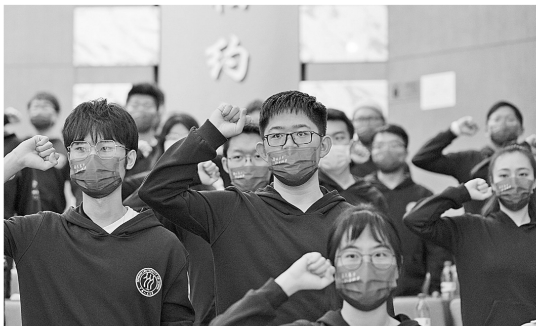
志愿者进行集体宣誓