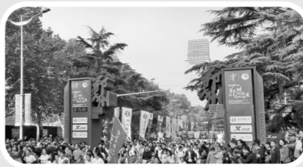
郑州国际马拉松赛