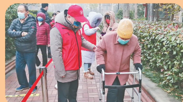
根据疫情防控需要，连日来，市文广旅局持续派出疫情防控党员突击队协助社区开展核酸检测志愿服务。

青史如鉴映初心，气贯长虹启征程。站在全新的历史起点，郑州市文化广电和旅游局全体干部职工将持续从党的百年奋斗历程中汲取智慧和力量，在助力郑州国家中心城市建设工程中展现新担当、新作为，始终坚持把实事办好，把好事办实，奋力谱写出郑州文旅高质量发展融合发展的多彩乐章。