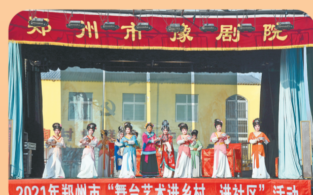
2021年郑州市“舞台艺术进乡村、进社区”活动