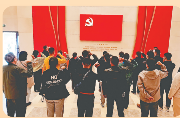
2021年10月22日，市文广旅局组织党员干部参观二七纪念馆，并举行预备党员集体入党宣誓仪式。