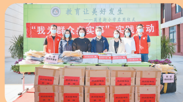
2021年9月8日，郑州图书馆工作人员到英才街小学开展“我为群众办实事”实践活动，为该学校捐赠学习生活用品。