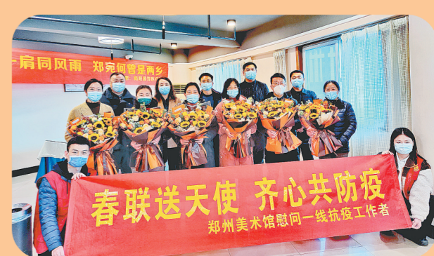
2022年1月12日，郑州美术馆与中原区莲湖街道办事处联合开展致敬“最美逆行者”活动，为支援郑州抗疫的南阳援郑医疗队送去春联和画轴。