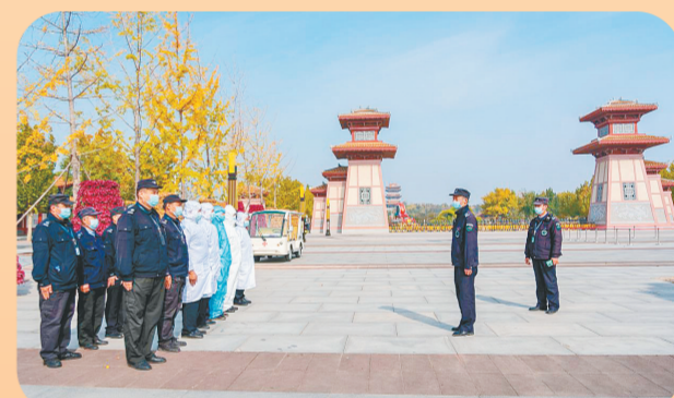
2021年10月27日，市文化市场综合行政执法支队联合有关部门在郑州园博园开展疫情防控应急演练。