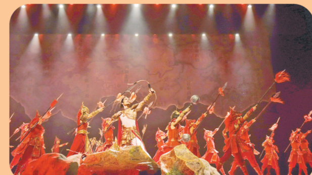
2021年4月29日，中国（郑州）黄河文化月·黄河流域舞台艺术精品演出季演出现场，由郑州歌舞剧院创排的原创新剧《精忠报国》精彩上演。