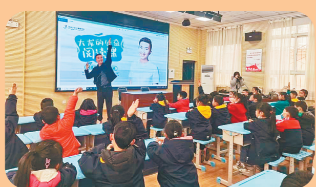
2021年，由市文广旅局主办，郑州少年儿童图书馆与郑州广播电视台联合办的“红色故事进校园”活动受到学生们喜爱。