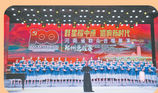
2021年5月28日，由市文广旅局主办、郑州文化馆等承办的“群星耀中原 唱响新时代”——河南省群众合唱展演郑州选拔赛举行。