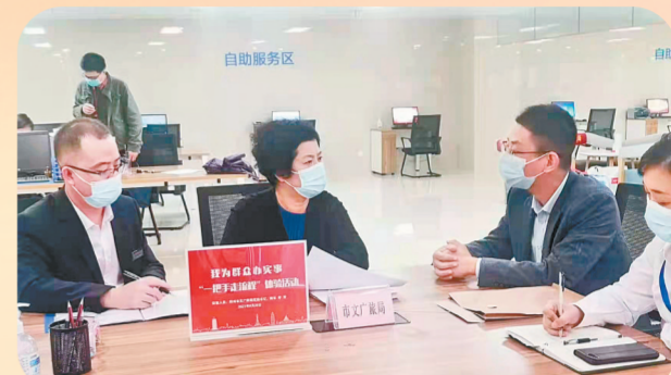
为切实解决企业及群众办事过程中的难点、堵点问题，2021年9月28日，市文广旅局开展“一把手走流程”体验活动。