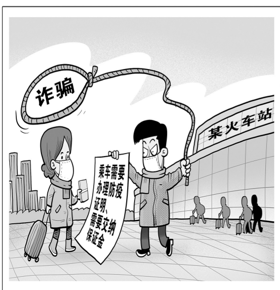
诈骗手法