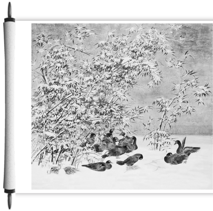
风雪又一程(国画) 宋延生