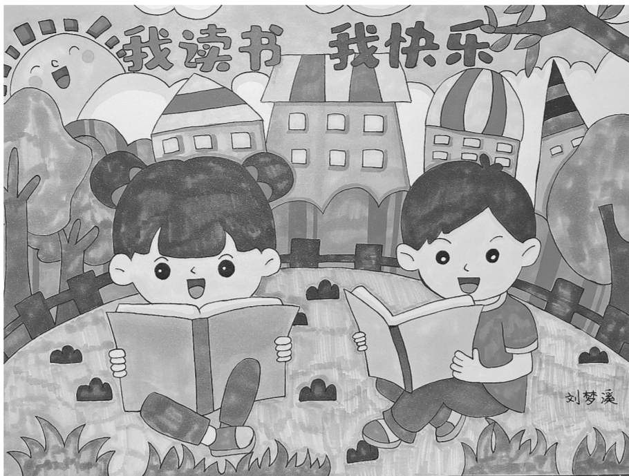
我读书 我快乐 金水区黄河路第三小学 刘梦溪