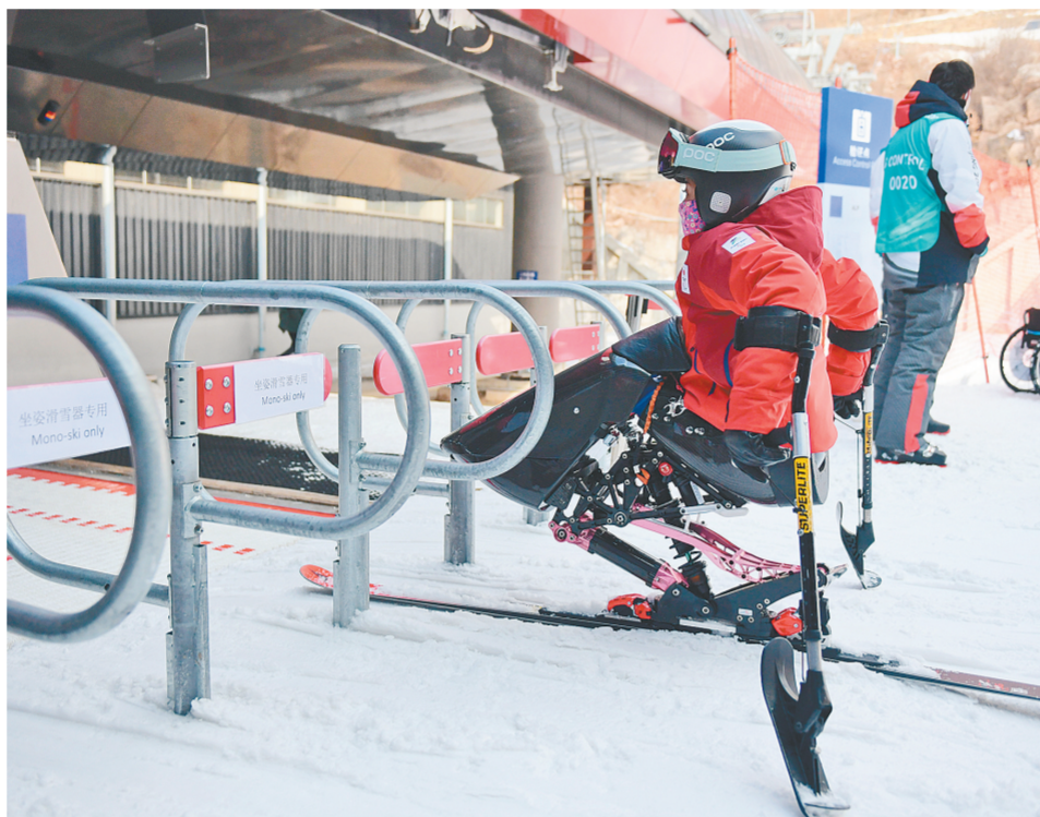
2月28日,运动员在国家高山滑雪中心准备乘坐缆车。目前,北京冬残奥会延庆赛区国家高山滑雪中心无障碍设施建设基本完成。场馆共设置永久、临时无障碍电梯共23部,无障碍坡道25个,此外还设置了无障碍卫生间、无障碍座席等。

“延庆的高山滑雪中心条件非常棒,赛道很好,我已经开始期待在这里比赛了!”挪威残疾人高山滑雪运动员耶斯佩尔·彼得森说,“我有信心在北京滑得更快!”