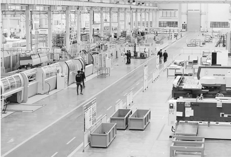
虎克电梯全自动柔性制造生产车间

本报讯(记者 史治国 通讯员 张星 文/图) 昨日，记者从荥阳获悉，今年以来，该市以“万人助万企”活动为契机，下好先手棋，力夺开门红，为完成全年目标奠定坚实基础。