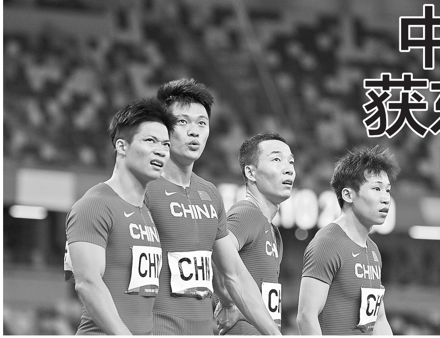
苏炳添、谢震业、吴智强和汤星强(从左至右)在东京奥运会比赛后

新华社北京3月21日电 世界田联官网近日更新了包括苏炳添在内的中国男子4x100米接力队成员资料介绍,在荣誉一栏中,均添加了“奥运会铜牌得主”。