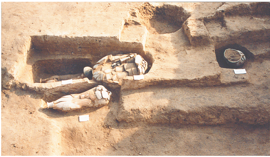
西山遗址北城门西侧的奠基遗存

西山城池的面世，将中国筑城历史向前推进了1000余年，成为当时中国发现的最早城池。”化学学者阎铁成说，他向人们证实，在5300年前，郑州地区率先开启古国时期，开始迈向文明时代。