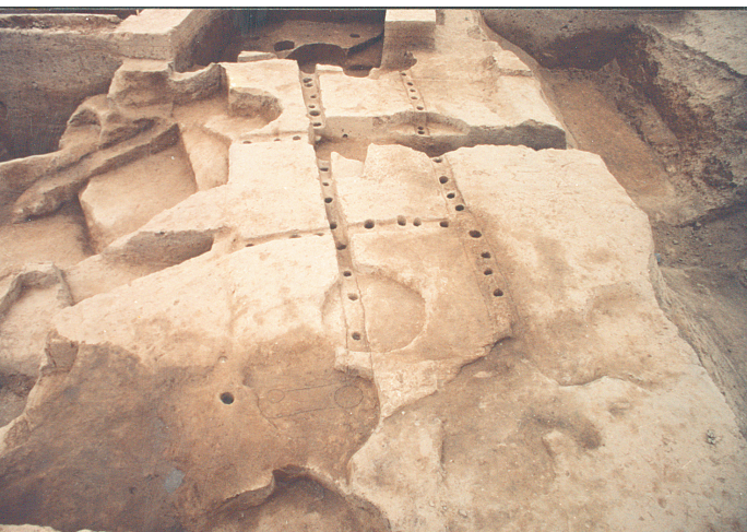
西山遗址西北隅城墙平面