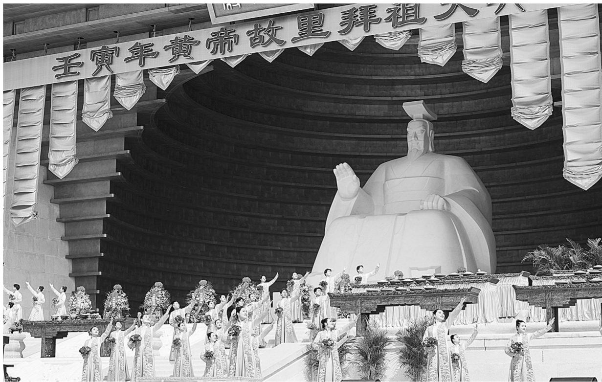
4月3日上午,壬寅年黄帝故里拜祖大典在郑州市新郑黄帝故里举行

“黄河文化”和“VR寻根”板块,中华儿女不仅能直观了解黄河文化各项活动,拜祖大典的实时新闻资讯,还能通过VR视角,线上游览“壬寅拜祖现场”“双槐树遗址”“黄河博物馆”等6个实景。重读中华优秀传统文化最为绚烂的华章,在线上“行走郑州,读懂最早中国”。