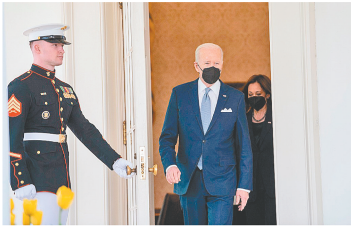
4月11日，美国总统拜登(左二)准备在华盛顿白宫发表讲话。

正在认真考虑向乌克兰提供短程反舰导弹。一名国会资深助理则认为，最新援乌军备很可能包括重型地面火炮系统，如榴弹炮。