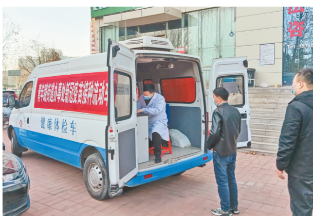
村民在流动接种车前有序排队接种新冠疫苗

本报讯(记者 卢文军 通讯员 王云岭 文/图)4月13日一早,在中牟县青年路街道东关村委院内,村民正在有序排队接种新冠疫苗。“早就听说要接种疫苗,年纪大了行动不方便,出了远门,听说今天有疫苗接种车进村,我就赶紧过来接种了!”东关村76岁的张大爷高兴地说道。为方便群众就近接种新冠疫苗,中牟县青年路街道以全力推动工作的“决心”、周密部署的“细心”和便民利民的“暖心”,建立起街道、村