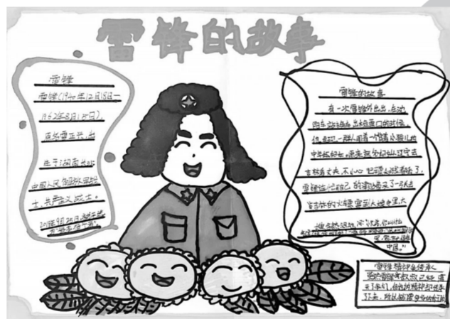
雷锋的故事 中原区淮河路小学 和硕 辅导老师 李佳

点评:小作者以给雷锋写信的方式,歌颂雷锋精神,争做雷锋传人。文章构思巧妙,从一首歌写起,用三个排比段叙事,很有气势,相当难得。