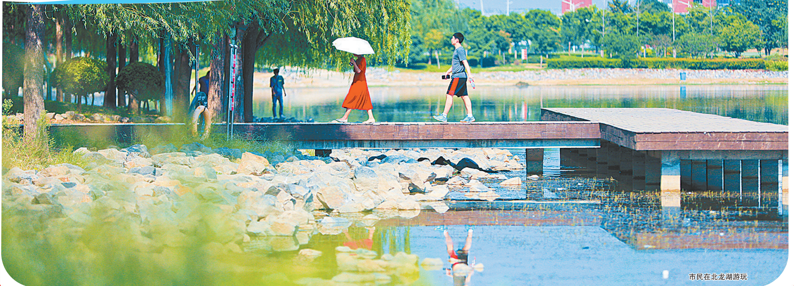
市民在北龙湖游玩