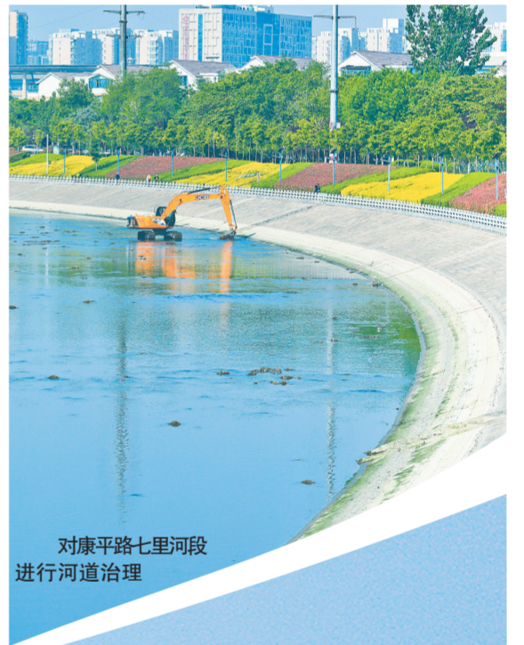
对康平路七里河段进行河道治理

污治污、河道治理、生态修复等系统治理，其中，对贾鲁河11.1公里黑臭水体按照“安全河、生态河、景观河、文脉河、幸福河”目标进行治理。2018年，完成市区城市黑臭水体整治任务，并获得生态环境部、住建部督察组的好评。 2021年，全市6个国控断面全部达到IV类以上，其中贾鲁河尖岗水库断面为I类水质，黄河花园口断面为II类水质，4个省控断面3个为III类水质，1个为IV类水质；全市12个市控断面中，除枯河入黄处断流外，有6个达到III类水质，5个达到IV类水质，全面消除V类及劣V类断面。