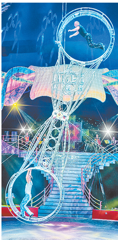
动体验,更加新颖的互动形式,将让游客应接不暇。

作为省内独具特色的沉浸式电影潮玩地,电影小镇正在积极筹备沉浸式艺术演出,融入电影《马戏之王》。参与旗袍舞会、看旗袍演出、拍旗袍大片照……多样的玩法,更加丰富的活