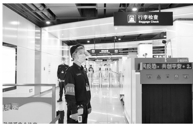
假期期间，郑州地铁一线员工坚守岗位，全力保障假期里轨道交通正常运转，守护乘客健康和平安。