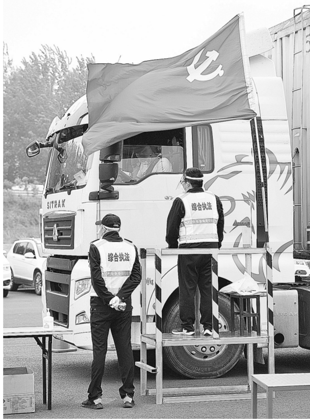
五一假期是人员流动高峰期，防疫形势严峻，全市各行业加强安全防范措施，全力防范各类生产安全事故发生，确保市民过一个健康、祥和、平安的节日。图为假期期间，工作人员在航空港区高速下站口执勤。