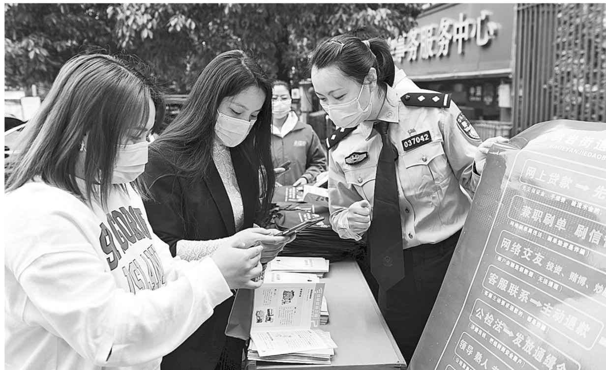
5月16日,贵州省贵阳市云岩区八鸽岩街道干部和民警为群众讲解防范电信诈骗知识。5月17日世界电信日到来之际,各地开展多种活动,迎接世界电信日。

从人类社会的发展历史来看,核心价值观总是由统治阶级所倡导并由统治阶级的统治力保证其优势地位的。它往往担负着指导和评价人们行为的作用,通过引导、影响、左右更多个体的价值取向和价值选择,来达到该群体中个体思想观念的高度一致,使个体的活动能从分散趋向集中,从而保证社会价值目标较顺利地实现,更好地促进社会发展,保持社会稳定。