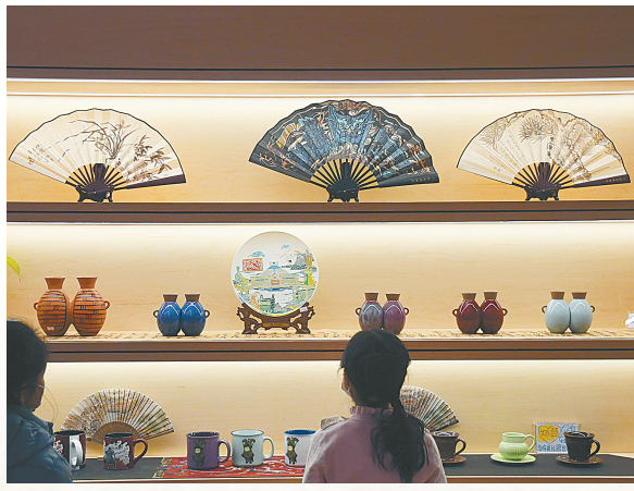
上图:丰富的文创产品吸引市民参观 左图:沿黄九省区金玉特种工艺珍宝展

“招募志愿者,服务我先行”。今日,启动河南博物院2022年度志愿者线上招募,举办“我用我心讲党史”教育活动,开展“豫博红”志愿服务,为公众提供义务讲解、教育互动、咨询引导、文明参观倡导等多项服务。 华夏古乐板块,今日11:00、16:00,河南博物院华夏古乐团将献上“金石新声——2022国际博物馆日主题古乐赏析会”,用中原古代金石之声创编演奏展示古代和现代乐曲。