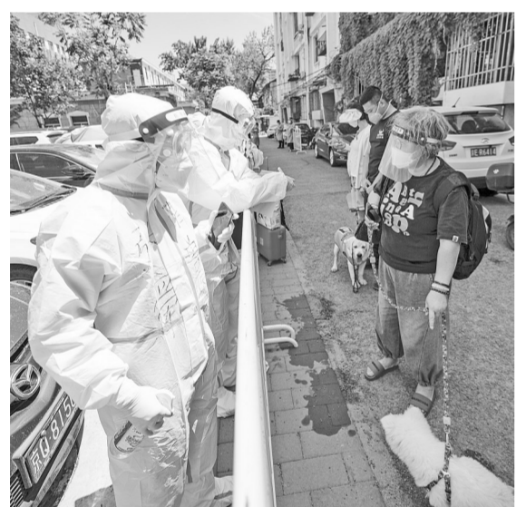
穿好防护服，提着宠物航空箱，在街道工作人员的引导下，北京一家宠物医院的兽医走进北京市海淀区一处管控社区。和几位养宠居民进行细致沟通并签署协议后，他们将宠物带离，由专车运往位于通州区的一家专门接收集中隔离居民宠物的宠物店。近日，为解决部分因疫情集中隔离居民的宠物照料问题，中国兽医药学会动物福利分会、北京小动物诊疗行业协会和相关企业、志愿者等组织数十家宠物诊疗机构，接收集中隔离居民的宠物。

新华社北京5月26日电(记者 彭韵佳)记者26日从国家医保局获悉，针对新冠病毒核酸检测费用问题，国家医保局有关负责人表示，按照《关于做好新冠肺炎常态化疫情防控工作的指导意见》《关于加快推进新冠病毒核酸检测的实施意见》，常态化核酸检测费用由各地政府承担。目前各地均由财政部门对常态化核酸检测提供资金支持。为抗击新冠肺炎疫情，国家医保局部署各级医保部门采取多种措施，推动新冠病毒核酸检测多轮降价，降低疫情防控成本。根据国家医保局、国务院联防联控机制医疗救治组日前印发的通知，对于政府组织大规模筛查和常态化检测的情况，要求检测机构按照多人混检不高于每人份3.5元提供服务。据介绍，参保患者看病就医时发生的核酸检测费用，可以按规定由医保基金支付。